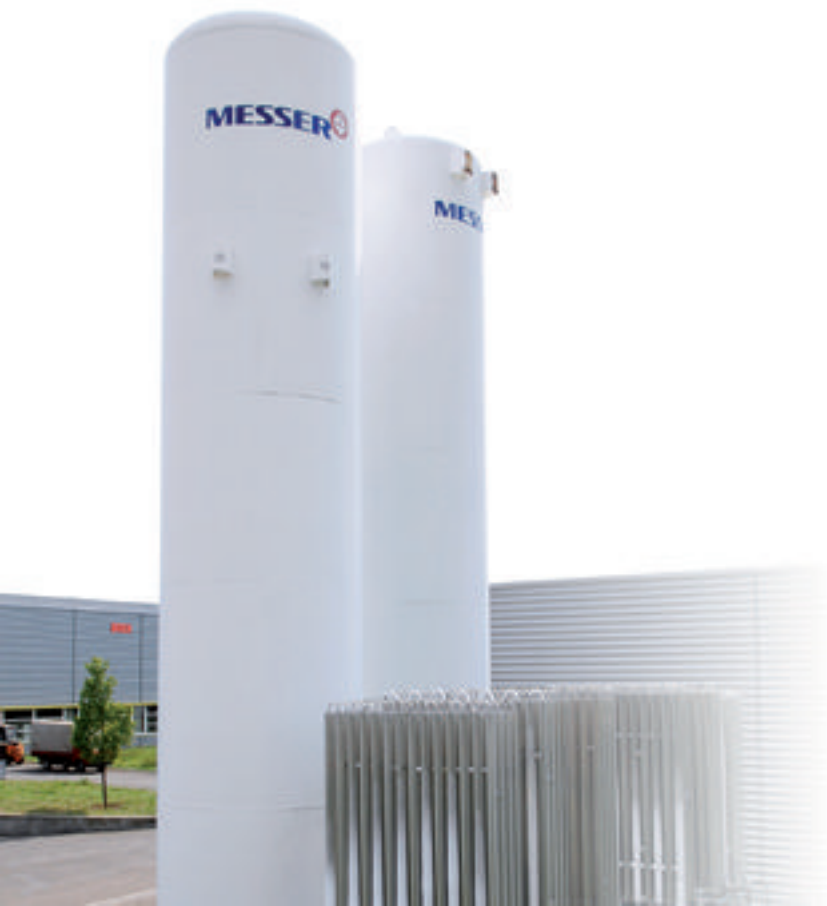
Speichertank für flüssigen Stickstoff

Durch das CoolSold-Verfahren von Messer wird die Stickstoffkälte auch zur Kühlung der Kondensationsfilter der Lötanlage genutzt. Die elektrischen Kühlaggregate, wie sie entsprechende Lötanlagen zur Kühlung der Filter besitzen, kommen dadurch deutlich seltener zum Einsatz. Dies schlägt sich in einem geringeren Stromverbrauch nieder, wodurch sowohl Kosten, als auch die Entstehung von CO 2 gesenkt werden.