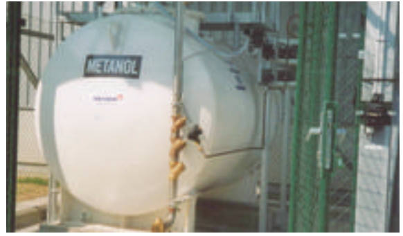
Die Bevorratung von Methanol erfolgt im Freien.