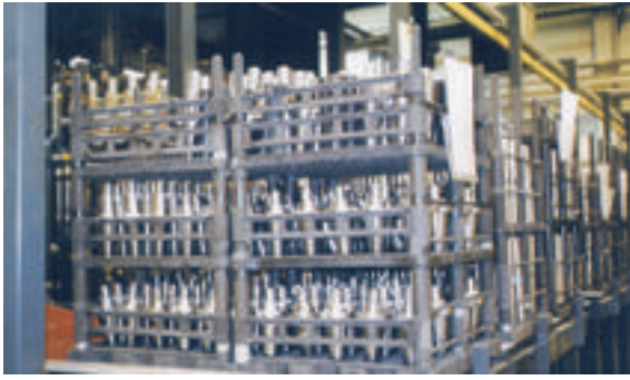
Bauteile im Chargierkorb