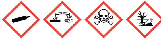
GHS04 GHS05 GHS06 GHS09