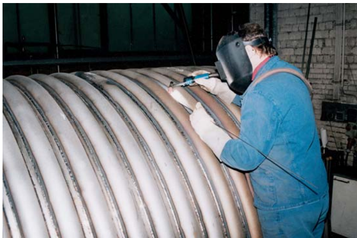
1. ábra. Csőrendszer felhegesztése AWI hegesztéssel hűtött keverőtartályra

A Cr-Ni acélokat korrózióállóságuknak és kedvező feldolgozási tulajdonságaiknak köszönhetően egyre növekvő mértékben alkalmazzák a legkülönbébb ipari és kisipari gyártási folyamatokban (1. ábra). Ezen belül a vegyiparban számos kedvezőtlen körülménnyel találkozhatunk, amelyek jelentős befolyást gyakorolnak a korrózióra. E körülményeket legtöbbször meleg vagy hideg savak, meleg vagy hideg lúgok, illetve meleg korrózív gázok jelenléte idézi elő, illetve ezek különféle mechanikai terheléssel is kombinálódhatnak. Az erősen ötvözött acélok klasszikus alkalmazási területein – így például a vegyiparban -- a szabványos, mintegy 6-8 százalékos deltaferrit-tartalmú ausztenitek mellett a nagyobb korrózióállóság eléréséhez egyre szélesebb körben alkalmaznak javított tulajdonságú alapanyagokat, például teljesen ausztenites, duplex és szuperduplex acélokat.