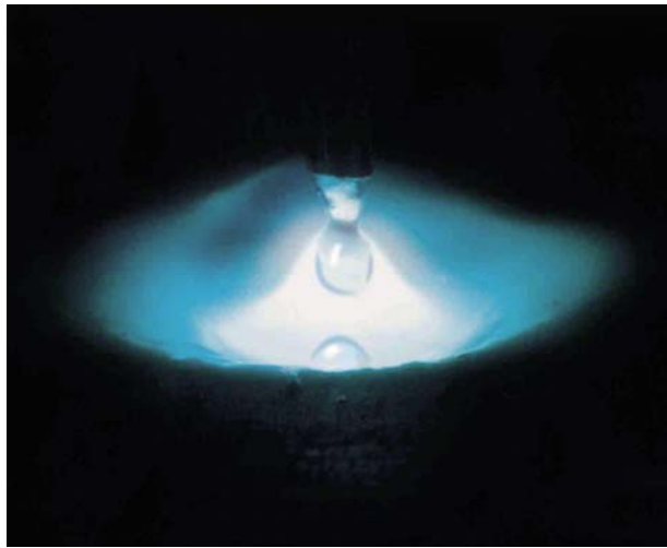
2. ábra. Argomix 4 védőgázt alkalmazó lökettőíves hegesztés nagy sebességű kamerával fényképezve

Az erősen ötvözött anyagok MAG hegesztésekor -- kisebb lemezvastagság-tartományban -- az impulzustechnika alkalmazása ajánlott (2. ábra). A vegyipari berendezések építésein a korrózióállóság fenntartására különösen a fröcskölésmentes, egyenletes, sima és oxidszegény varratokra kell ügyelni. Az áramforrások általában fix impulzusprogramokkal működnek, amelyeket minden esetben hozzá kell igazítani a héliumtartalmú keverékekhez. Az impulzustechnika lehetővé teszi az összes járatos ívtartomány, például a rövid ívű és a szóróíves hegesztés használatát, zavaró átmeneti tartományok nélkül.