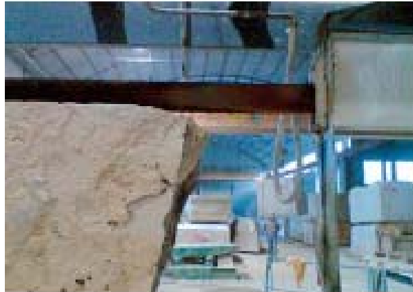
A travertin megmunkálása: kevesebb vízigény szén-dioxid hozzáadásával

kalcium-karbonátot képes felvenni, így elkerülhetőek a nem kívánt lerakódások. Ezzel az eljárással nemcsak a friss víz felhasználás csökkenthető, hanem a kőzet optikailag világosabbá, ezáltal szebbé válik.